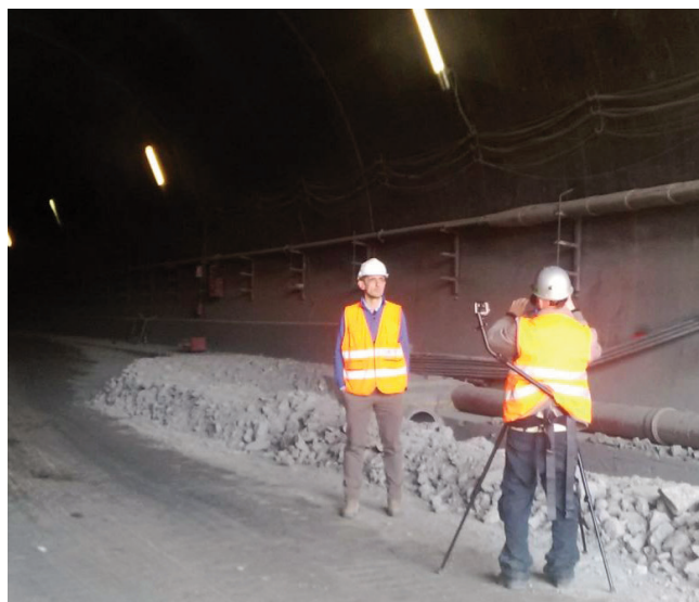
Alcuni scatti della giornata nella Variante di Valico