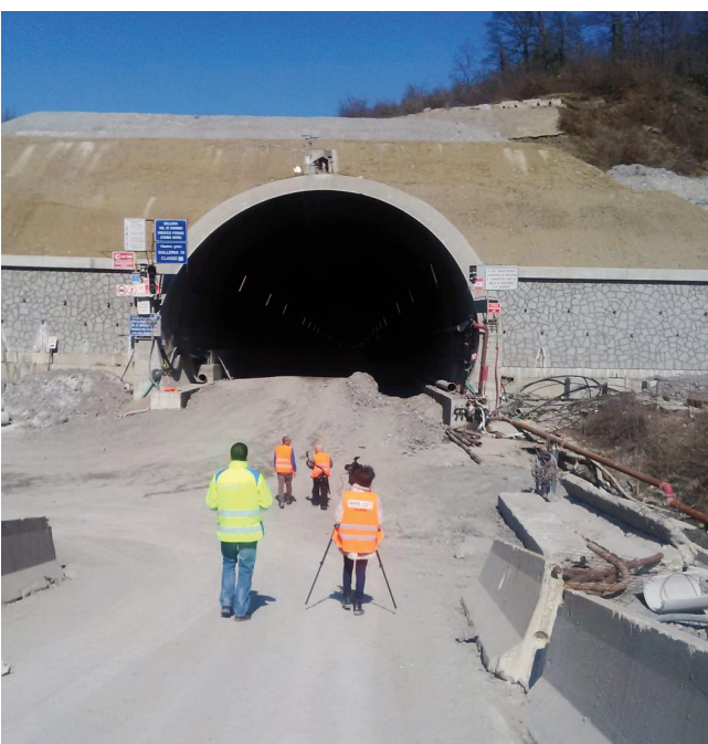
Alcuni scatti della giornata nella Variante di Valico

per l'Italia, che ha risposto alle tante domande e curiosità sulla storia del progetto, i tempi, le sue caratteristiche e le innovative tecniche di costruzione. L'appuntamento con la Variante di Valico è fra qualche mese su Discovery International Channel!