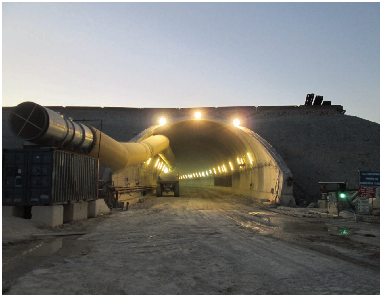
La galleria Sappanico in costruzione, canna Sud, in una foto del 2013

Ecco, a scriverlo e a raccontarlo sembra semplice, quasi banale: in realtà si tratta di un notevole passo avanti nella messa a punto dei metodi contro gli infortuni sul lavoro. Una novità certamente destinata a segnare una svolta nella costruzione delle gallerie autostradali, ma anche in quelle stradali e ferroviarie. La nuova centina, con il suo brevetto e le sue particolarità, offre una soluzione rapida e sicura, nel pieno rispetto del progetto. E di chi lavora per realizzarlo.