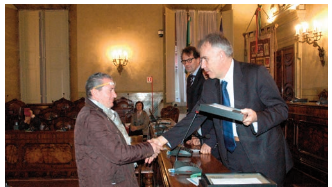
Alcuni momenti della premiazione