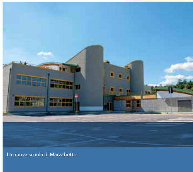
La nuova scuola di Marzabotto

nell'attuale momento di crisi. È ora il momento di puntare sulle forze vive del tessuto collettivo: come nel dopoguerra, quando l'Italia è divenuta il settimo paese industrializzato, grazie all'ingegno e alla passione dei suoi abitanti. Ma, a ben guardare, i due elementi hanno già avuto modo di intersecarsi: il 3 dicembre 1960, per inaugurare l'autostrada del Sole, transitò per i paesi ora interessati dalla Variante di Valico, l'allora Presidente del Consiglio Amintore