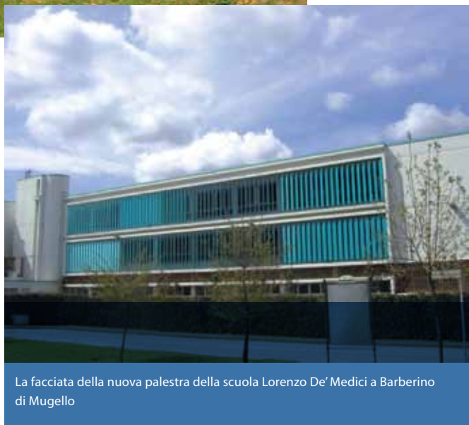
La facciata della nuova palestra della scuola Lorenzo De' Medici a Barberino di Mugello