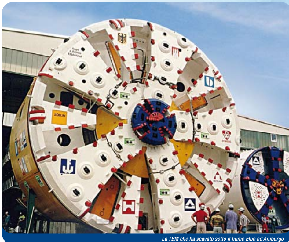
La TBM che ha scavato sotto il fiume Elbe ad Amburgo

Direttore Operativo Sviluppo Rete Autostrade per l'Italia