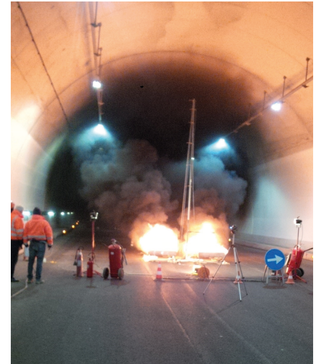
Prova antincendio in galleria Manganaccia